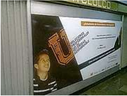
Premio Soluciones Profesionales para una Seguridad Responsable: campaña en el metro de CDMX con el apoyo del GDF, así como premiación en el Museo Soumaya de la CDMX

Nuestro compromiso es innovar, facilitar, desarrollar y acompañar al máximo nivel la oportunidad sostenible de crecimiento ante la adversidad, de las diferentes personas e instituciones en México e Iberoamérica