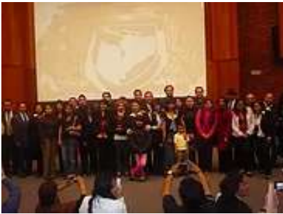
Premio A lo Mejor de la Psicología en México, premiación en FM, UNAM