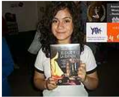
Apoyo para el desarrollo de la niñez y juventud, Foro UAM Emprendedores