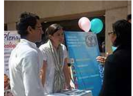
Participación activa en la Red de Voluntarios del IMSS CMN SIGLO XXI