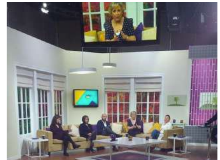
Participación en el programa de IPN Canal 11 Diálogos en Confianza