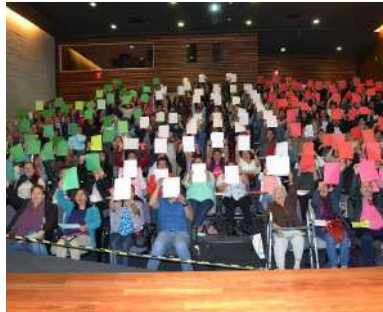
Capacitación en el Museo Memoria y Tolerancia CDMX