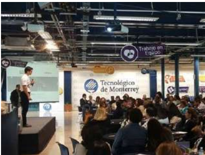
Resiliencia y desarrollo humano sostenible en el Tec de Monterrey