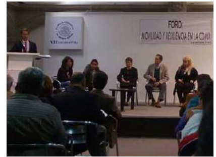
Presentación de la Ley de Resiliencia de la CDMX en la Asamblea Legislativa